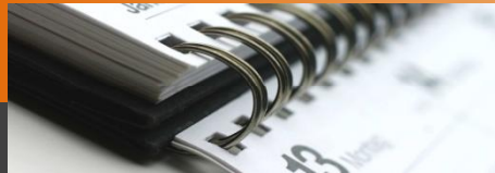
Werkstatt-Terminplaner Version 1.3